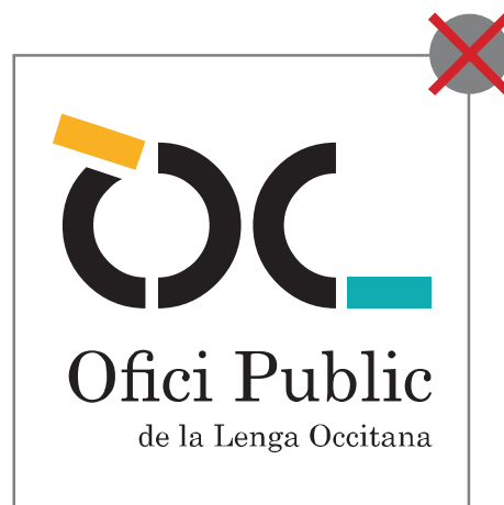
2 > ne pas modifier la typographie