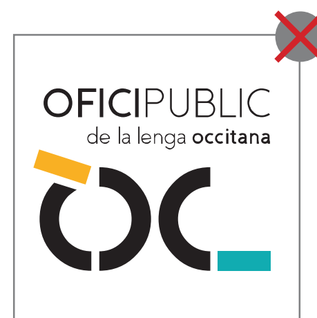
4 > ne pas modifier les placements