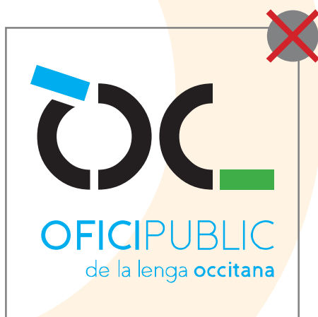
1 > ne pas modifier les couleurs

Le logotype doit être utilisé et reproduit sans aucune altération. Son dessin, sa typographie et ses couleurs ne peuvent être modifiés.