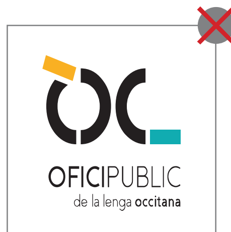
3 > ne pas déformer le logo ou modifier les proportions